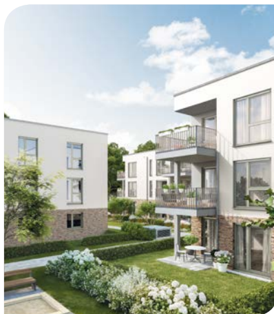
PROJECT Immobilienentwicklung »Schlosspark Ensembles«