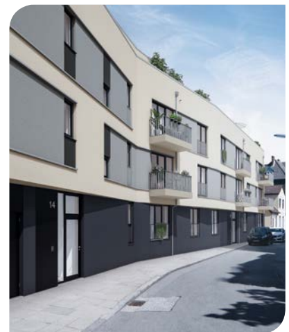
PROJECT Immobilienentwicklung »Die Bleichertwiete«

Wohnen im Hamburger Speckgürtel: Im Bezirk Bergedorf errichtet PROJECT Immobilien das Neubauensemble »Die Bleichertwiete«. Der Verkauf der insgesamt 30 Eigentumswohnungen hat bereits begonnen. In der Bleichertwiete 12,14 und 16 entstehen zwei parallel zueinander liegende viergeschossige Mehrfamilienhäuser inklusive Tiefgarage mit einer Gesamtwohnfläche von rund 2.010 m 2 . Die Fassade fällt vor allem durch elegante Fensterfronten und Zick-Zack-Verläufe auf. Im Innenhof steht den künftigen Bewohnern eine ruhige Gartenanlage zur Verfügung. Die 1- bis 4-Zimmer-Wohnungen mit Garten, Balkon oder Dachterrasse sowie Wohnflächen von 33 bis 104 m 2 eignen sich für Singles, Paare und Familien. Echtholzparkett,