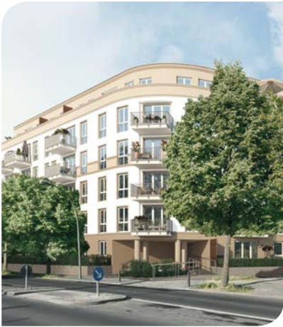
PROJECT Immobilienentwicklung »MEIN PANKOW«

zeit in der Provinzstraße 67/68 auf 4.685 m 2 Grundfläche 73 Wohneinheiten in gehobener Ausstattung im KfW-55-Standard. Das Gesamtverkaufsvolumen liegt bei rund 25,4 Mio.